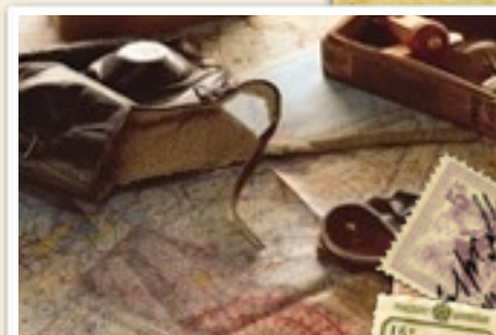
Rhoncus tembor blacerat.